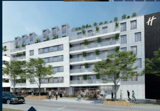
Ensemble immobilier à usage mixte - Hôtel, coliving, logements Nanterre (92) - Derbesse Delplanque Dupas Architectes Associés.