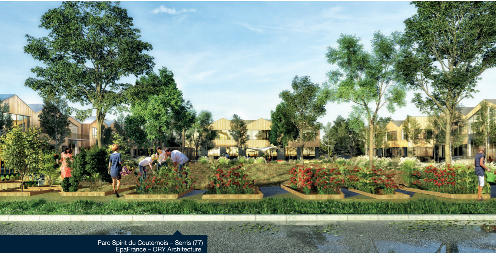
Parc Spirit du Couernois – Serris (77) EpaFrance – ORY Architecture.

Spirit déploie le Solar GEM® pour alimenter en énergie photovoltaïque son chantier du Parc Spirit du Mantois, situé au cœur du quartier Mantes Innovaparc à Buchelay (78)